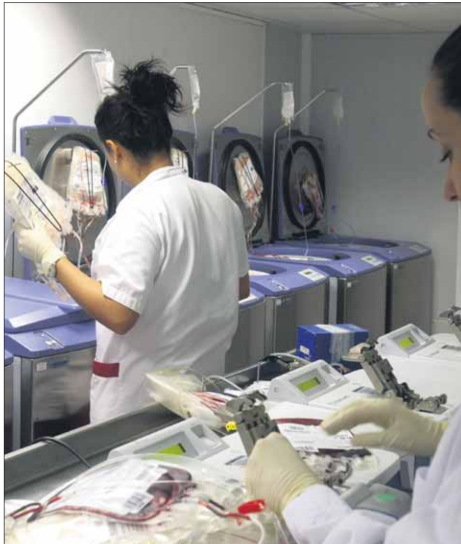
Les beques van dirigides a professionals sanitaris iberoamericans relacionats amb la medicina transfusional

L'OBJECTIU DE LES BEQUES ÉS FORMAR EN ORGANITZACIÓ I GESTIÓ DELS BANCS DE SANG