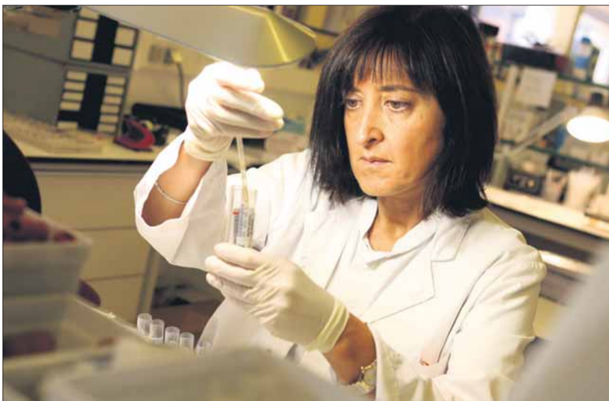
La majoria de casos de trombopènia neonatal al·loimmune es diagnostiquen en el moment del naixement

La trombopènia neonatal al·loimmune és una malaltia que pot ser greu i requereix, en molts casos, una transfusió de plaquetes del grup HPA-1a negatiu. Només el 3 per cent de la població té aquest grup sanguini per la qual cosa la donació és imprescindible. Les plaquetes són un component sanguini essencial perquè eviten les hemorràgies. Existeixen fins a sis grups plaquetaris coneguts, anomenats grups HPA (segons les sigles en anglès: Human Platelet Antigens ), i només al voltant d'un tres per cent de la població pertany al grup HPA1-a negatiu que és el que pot provocar, en el cas de les mares, la trombopènia neonatal al·loimmune (TNAI). S'origina com a conseqüència de la destruc-