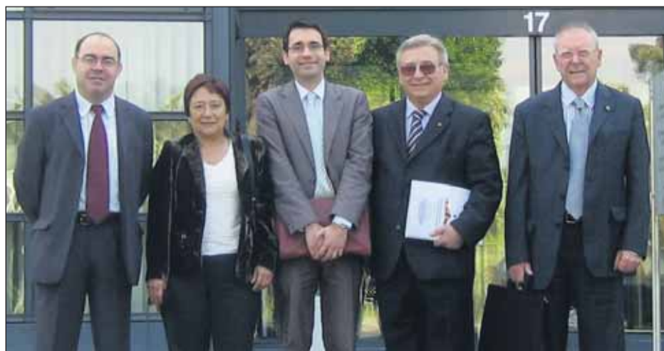
Els membres de la delegació que va defensar la candidatura de Barcelona 2010 a Ginebra

Com ja hem comentat, Barcelona ha consolidat un model de captació de donants basat en l'associacionisme i la promoció de la donació com un gest de solidaritat, responsabilitat i civisme. El compromís dels ciutadans i el dinamisme de les associacions converteixen la capital catalana en la portaveu idònia per transmetre l'agraïment mundial als donants. El Dia Mundial del Donant de Sang se celebra, cada any el 14 de juny, com a mostra de reconeixement als donants de sang de tot el món. També es pre-