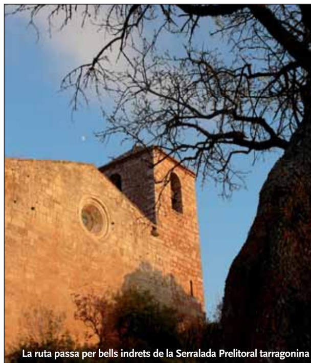
La ruta passa per bells indrets de la Serralada Prelitoral tarragonina

Més informació: www.larutadelsrefugis.com