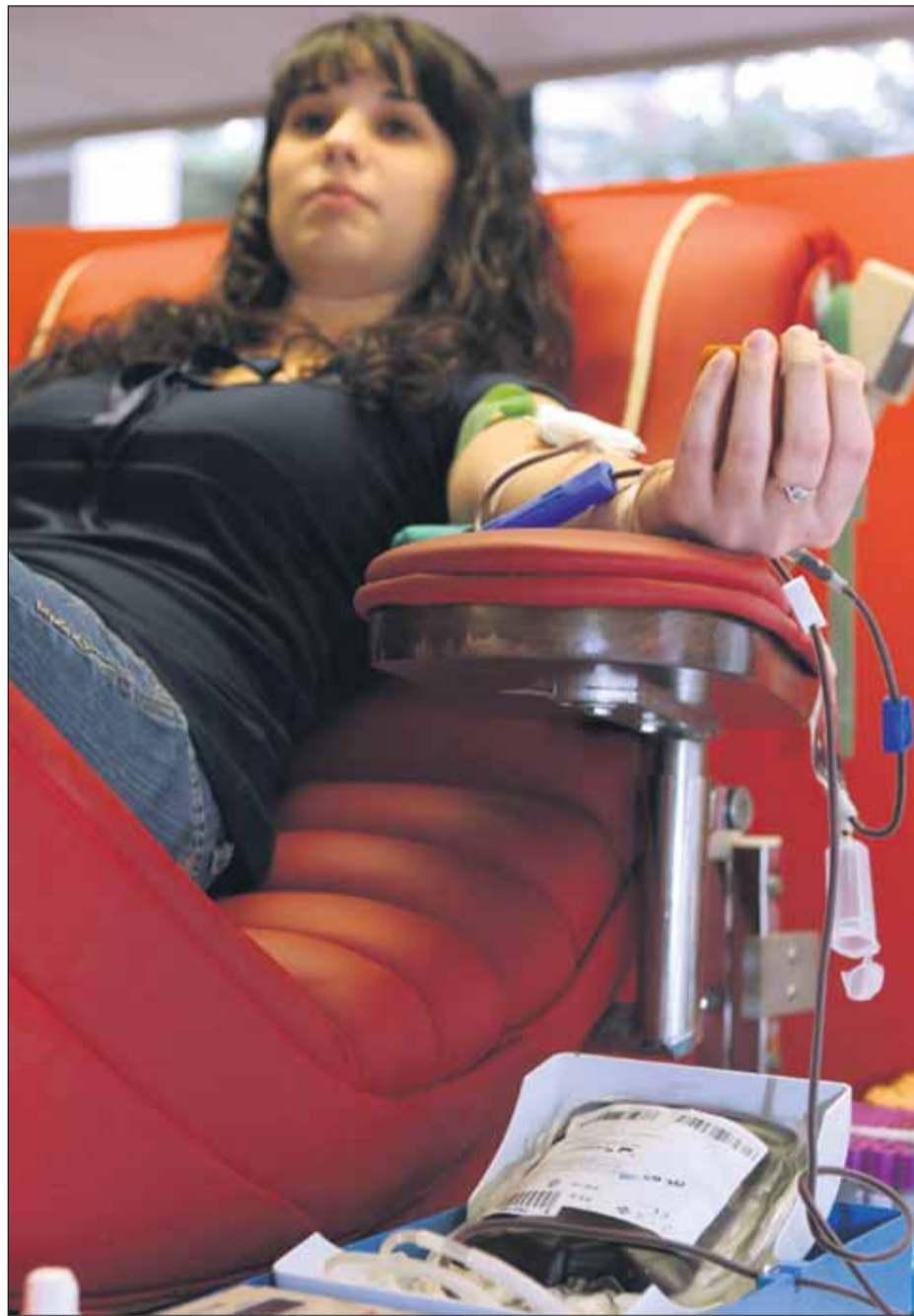
Les persones diagnosticades d'hepatitis A poden donar sang transcorreguts 6 mesos de la seva curació

En canvi, en els casos de les hepatitis B i C, no tots els malalts fan una curació espontània i alguns continuen presentant vi-