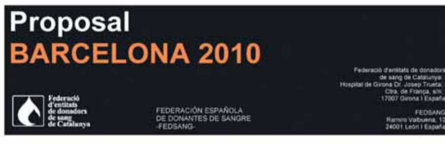
Portada de la sol·licitud presentada per proposar Barcelona com a seu del Dia Mundial del Donant de Sang

World Blood Donor Day "Celebrating the Gift of Blood" 14 JUNE