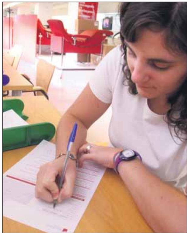
En la donació sempre s'apliquen criteris de màxima prudència

donants i dels receptors no es veu afectada. Malgrat això, quan en el banc de sang s'identifica una unitat de plasma amb una coloració excessivament blanquinosa per la presència de greixos és separada i destruïda per evitar el seu ús. Aquesta també és una mesura de màxima prudència, ja que si administrem una unitat de plasma (aproximadament 250 ml) d'un donant amb hipercolesterolemia a un