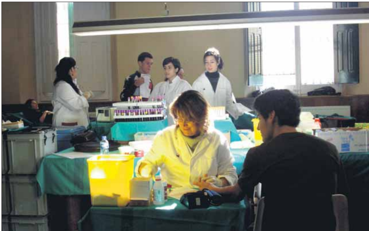
L'equip de Banc de Sang i Teixits atenent els donants a la sala de professors del centre

sabilitat de donar a conèixer la jornada als seus companys. La seva tasca s'accentua, sobretot, just després de les vacances de Nadal, quan se'ls convoca a una sessió informativa, on una tècnica del Banc de Sang i Teixits els explica els principals requisits per poder donar i els aclareix qualsevol dubte que puguin tenir. Posteriorment, penjaran un pòster informatiu a l'aula, repartiran fulletons, posaran un vídeo explicatiu, respondran a les preguntes dels seus companys i, finalment, faran el recompte de les persones que volen donar. Són dies