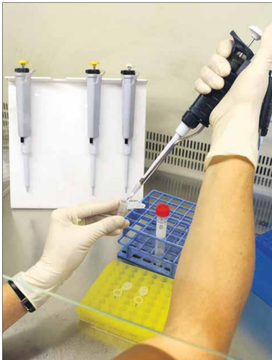
El futur de les teràpies cel·lulars avançades passa per trobar la clau de la regeneració cel·lular

de promocionar la investigació amb cèl·lules mare i la seva aplicació. Pel que fa a la resta de països europeus, es pot afirmar que Espanya és un dels estats capdavanters en teràpies cel·lulars avançades.