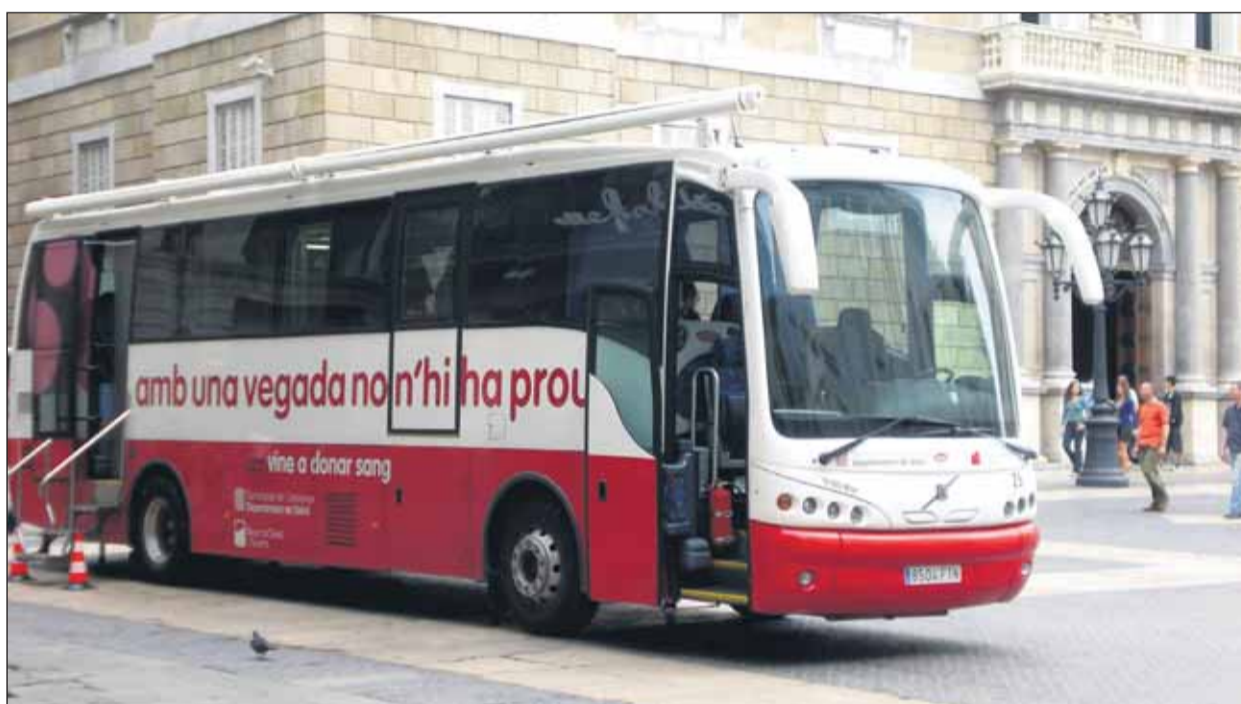
Durant l'any passat es van realitzar 5.456 campanyes de donació de sang amb equips mòbils, amb què es van visitar 602 municipis de Catalunya

donants van ser homes i el 49,16%, dones. Per edat, el grup més nombros (50,23%) es concentra en el tram dels 36 als 55 anys. El segueixen, els donants d'entre 26 i 35 (22,81%). Per regions sanitàries, les tres primeres posicions per nombre de donacions coincideixen amb les de l'any anterior: Lleida, Girona i Terres de l'Ebre. A banda, cal tenir en compte la regió sanitària de Barcelona, que engloba les comarques de l'àrea metropolitana, i que registra un total