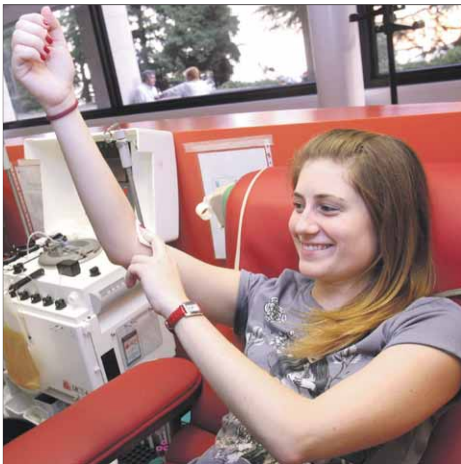
A partir dels 18 anys, tota persona sana i en circumstàncies normals pot ser donant de sang

En aquest sentit, les noves tecnologies de la informació resulten una eina molt útil per arribar als més joves, però no l'única. Així, el BST també s'apropa als