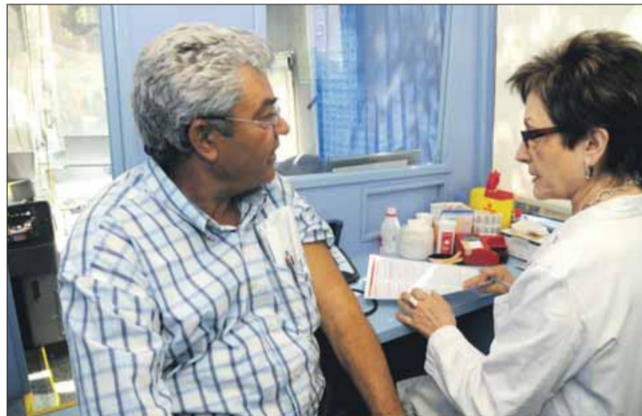
L'entrevista mèdica es realitza per detectar possibles situacions que fan aconsellable excloure el donant

Diverses organitzacions, com l'OMS, ofereixen uns dispositius d'alertes epidemiològiques a nivell internacional per tal que es pugui saber si hi ha brots d'alguna malaltia a qualsevol país del món. "Al llarg