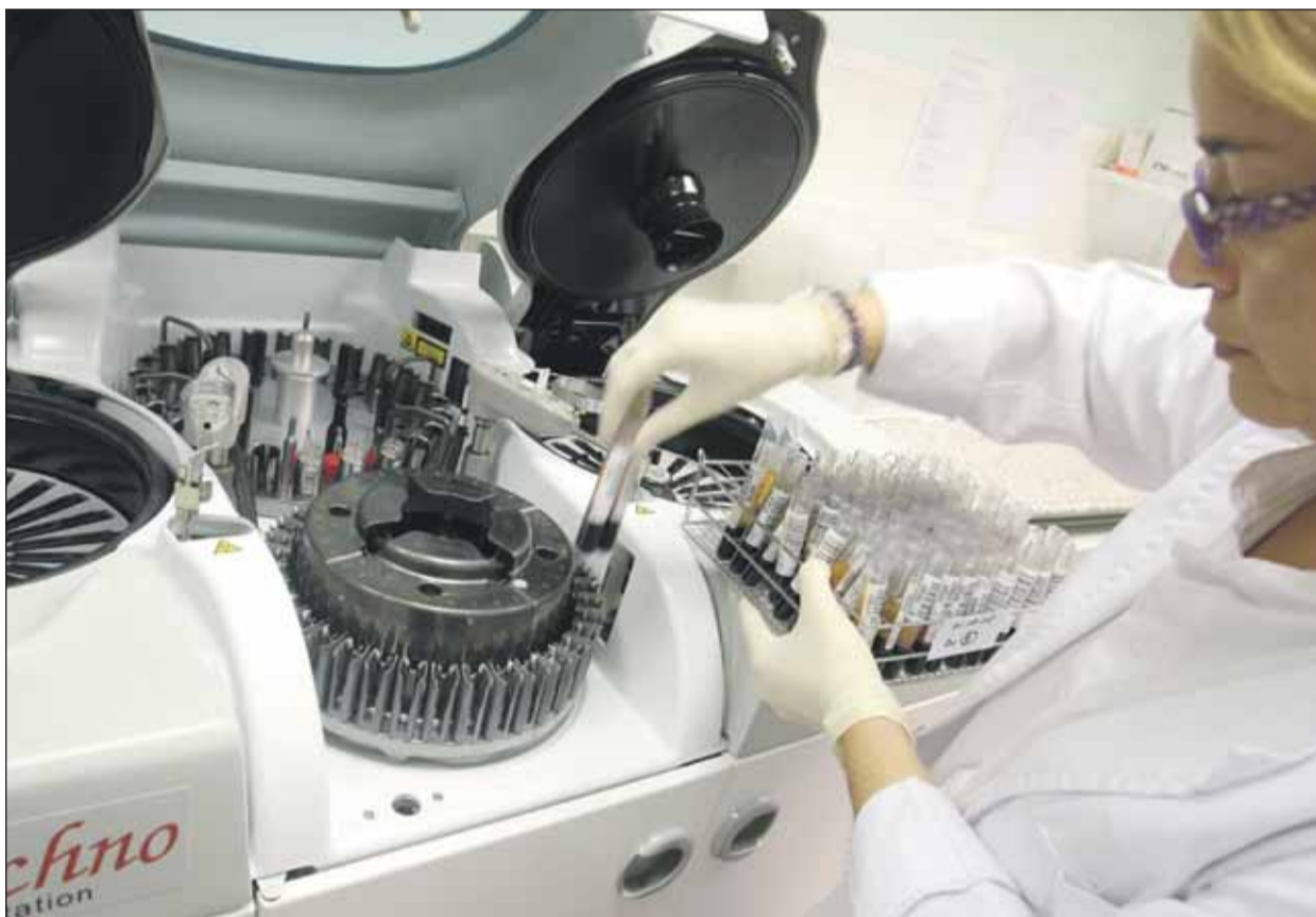
La sang dels donants que pertanyen a grups amb fenotips poc comuns es tracta i es congela amb les màximes condicions de seguretat

Tota la sang donada en condicions normals és bona i necessària. Però el cert és que hi ha alguns tipus de sang, que per la raresa dels seus grups sanguinis, la seva donació és especialment benvolguda. La majoria de persones d'una mateixa raça compartim uns grups sanguinis similars i que van molt més enllà dels grups ABO i del grup RH, ja que existeixen més de 300 tipus diferents. Alguns d'aquests grups sanguinis estan presents en el 99%, o més, de les persones, i són els anomenats grups sanguinis d'alta freqüència. Això vol dir que un 1% -o menys- de les persones no els tenen. Si les persones d'aquest reduït grup es transfonen amb sang dels altres poden desenvolupar anticossos que inicialment no causaran cap problema. Davant, però, d'una segona o successives transfusions, la presència d'anticossos pot provocar una reacció transfusional que pot arribar a ser molt greu. És per això que interessa disposar de sang d'aquestes mateixes persones no portadores dels grups sanguinis d'alta freqüència per tal de poder fer una transfusió compatible quan hi ha algun malalt que pertany a aquest grup de menys de l'1% de les persones que la pugui requerir. Per sort, també hi ha per-