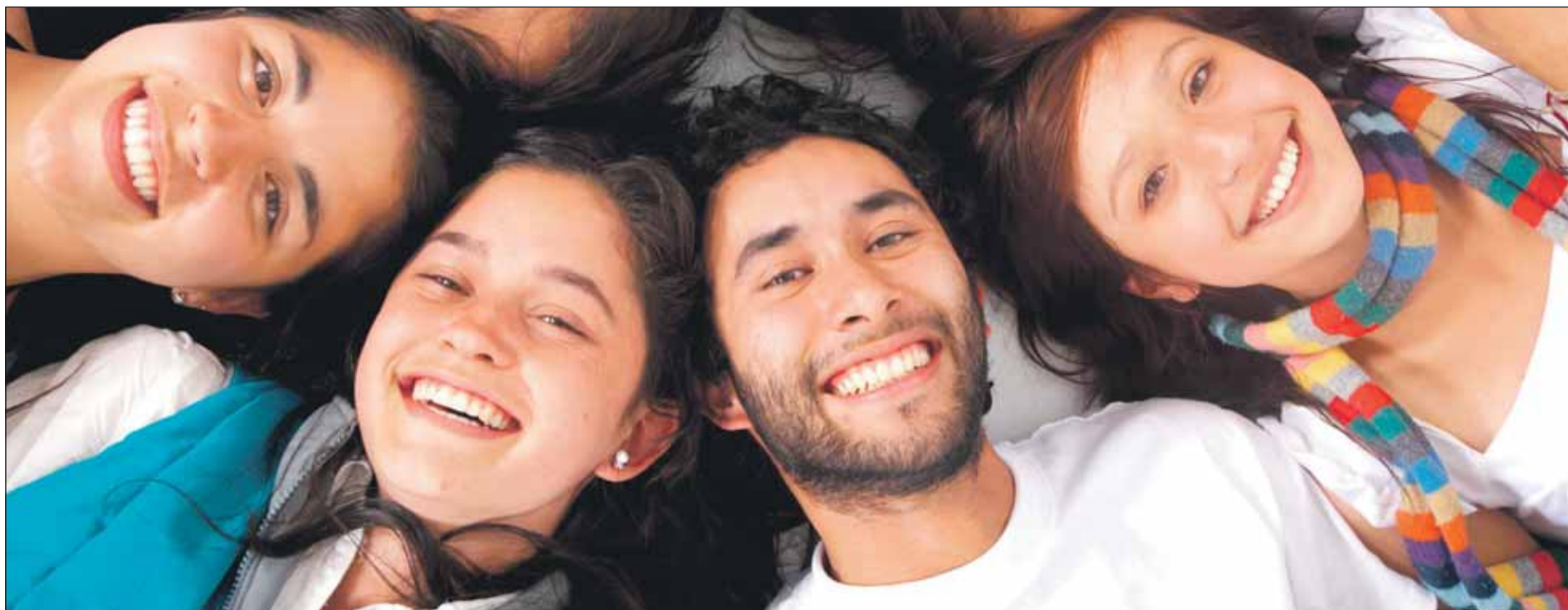
Implicar els joves en la donació, un dels principals objectius d'aquesta edició