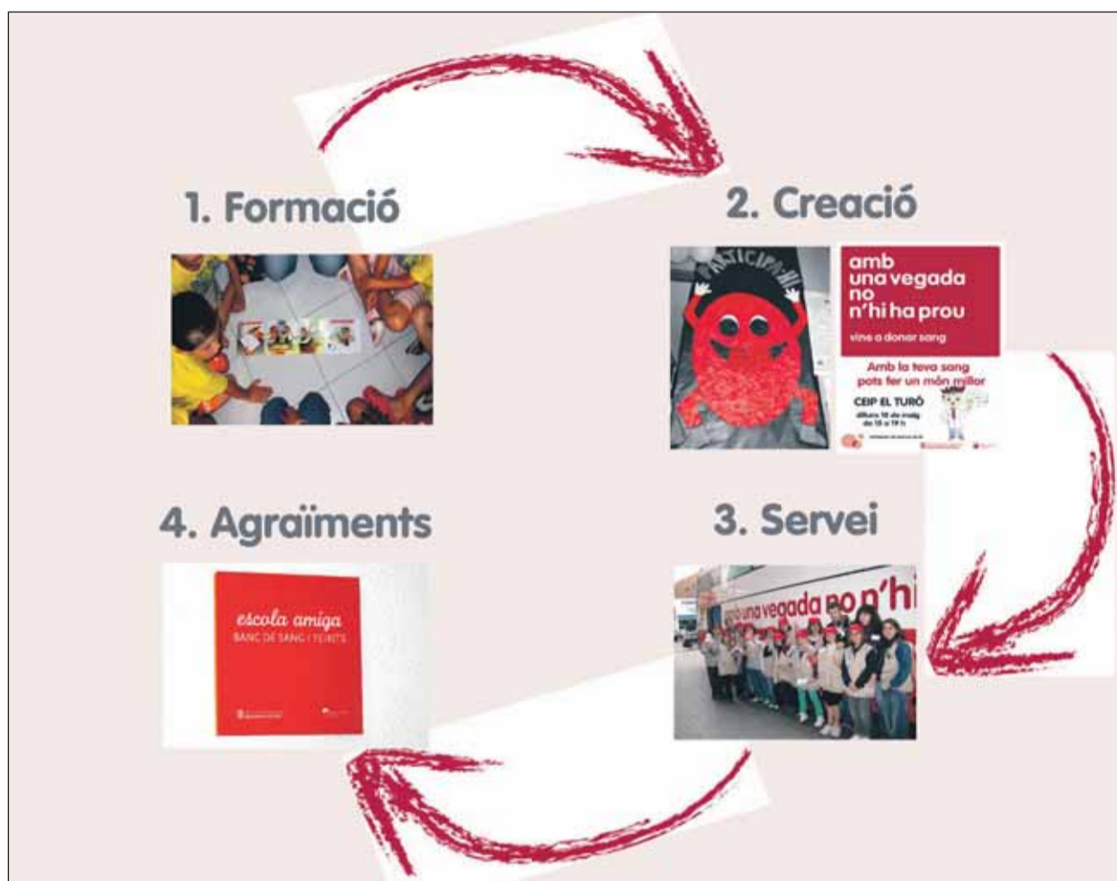
Una trentena d'escoles d'arreu de Catalunya participen cada any en el programa d'APS del Banc de Sang i Teixits

Per a més informació sobre el programa APS, podeu contactar amb el BST a través del correu: client@bstcat.net