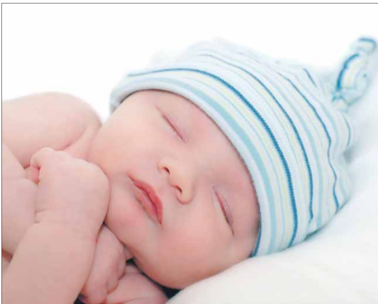
Les característiques especials de l'organisme del nadó fan de l'exanguinotransfusió un tractament molt delicat

Ara bé, quan la concentració de bilirubina a la sang és elevada i la fototeràpia no l'elimina, cal actuar amb celeritat perquè la bilirubina té la capacitat de traspasar la barrera hematoencefàlica, una protecció que separa