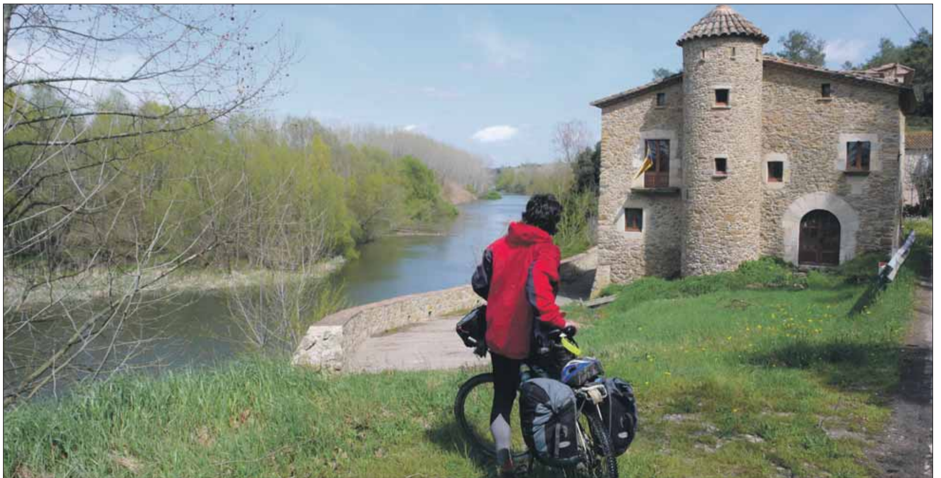
La Ruta del Ter transcorre per una gran diversitat de paisatges: muntanyenc, agrari, costaner, urbà, riberenc i d'aiguamolls

Tot travessant cinc comarques catalanes i al llarg de 176 km, aquesta ruta ens durà des dels Pirineus fins a la Costa Brava mentre descobrim els paisatges, la història i la cultura que s'han forjat al voltant del riu Ter, el nostre company inseparable durant tot aquest recorregut