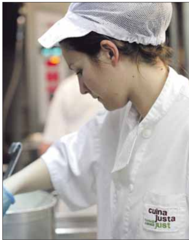
Cuina Justa, que va néixer el 1995, ja compta amb més de 100 clients

MÀXIMA QUALITAT Cuina Justa és una empresa que treballa amb uns estàndards de qualitat molt elevats, també exigits als propis proveïdors. Preparen un menú artesà i saludable, amb productes frescos i naturals. Jover puntualitza: "Els proveïdors estan molt ben escollits perquè busquem la màxima qualitat i volem que entenguin la nostra filosofia d'empresa i que ells també formin part del projecte; coneixen perfectament les nostres necessitats i objectius. Això és molt important perquè no podem córrer riscos". I és que fer compatible la tolerància, el respecte al ritme del treball de cada persona i, alhora, ser una empresa tan productiva com per ser capaç de servir 4.000 àpats diaris, requereix un màxim grau d'exigència. Per a Cuina Justa tan importants són els proveïdors