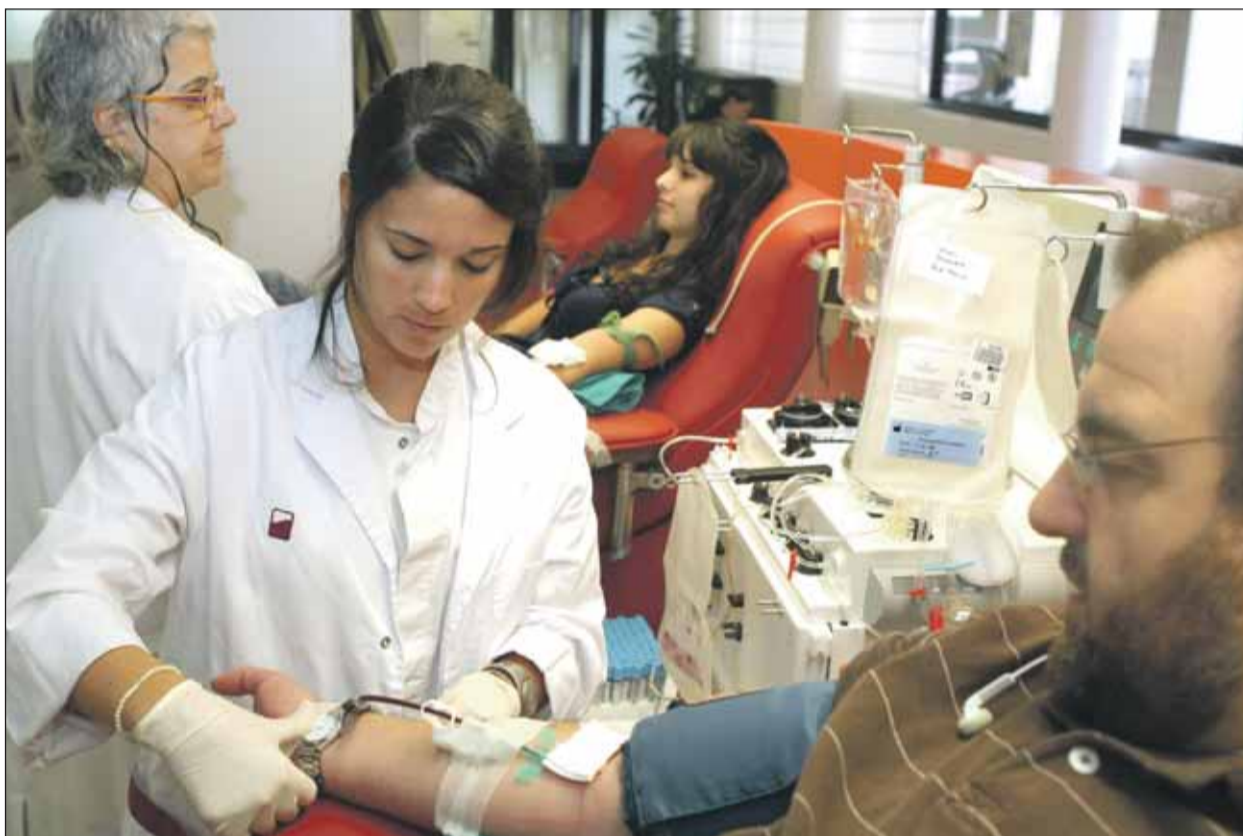
Per fer la donació de plaquetoafèresi, el donant es connecta a una màquina anomenada separador cel·lular

En primer lloc, davant de malalts refractaris oncològics. "Molts malalts (leucèmia, limfoma, trasplantament de medul·la òssia), que al llarg del seu període d'ingrés reben moltes transfusions de plaquetes, acaben fent-se refractaris, és a dir, no responen al tractament transfusional", explica la doctora Bosch. Les plaquetes de les persones no són totes iguals, sinó que cada persona les té amb unes especificitats concretes. I aquests pacients han rebut tantes plaquetes diferents a les seves que creen anticossos i fan que les transfusions no siguin efec-